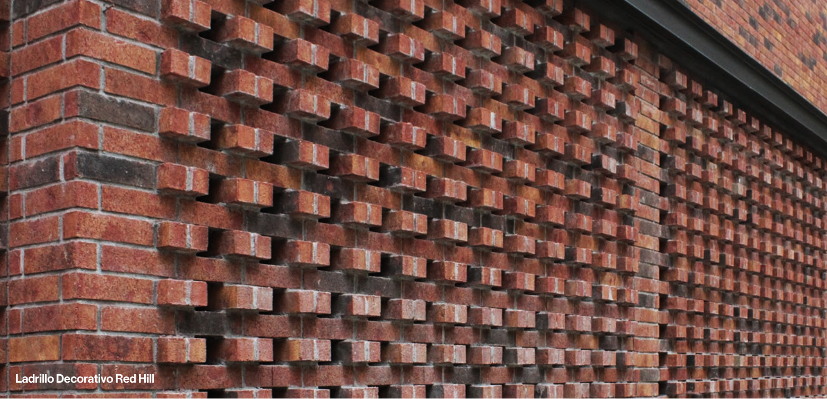
Ladrillo Decorativo Red Hill