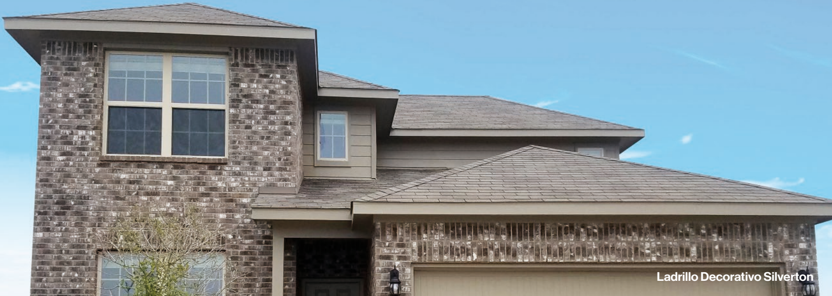
Ladrillo Decorativo Silverton