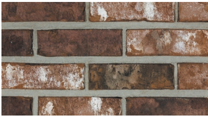
New Heaven Antique