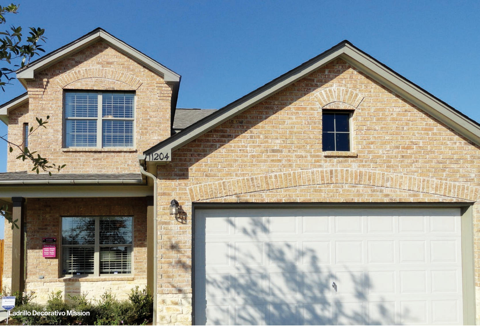
Ladrillo Decorativo Mission