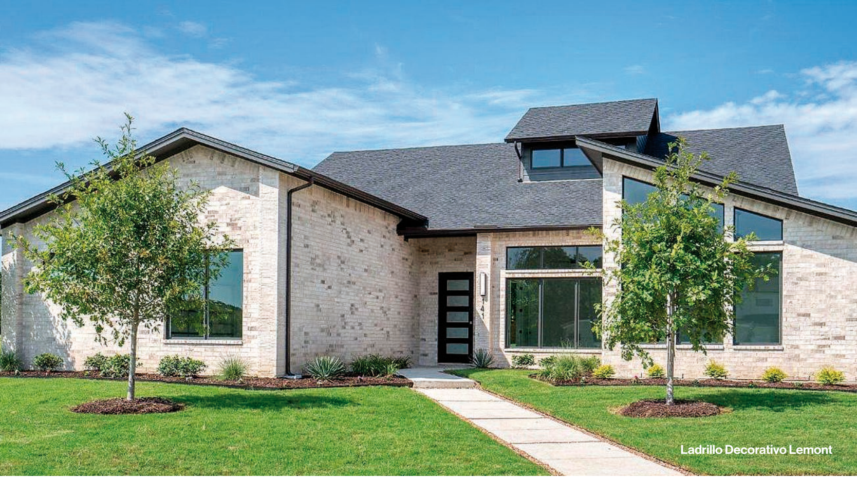
Ladrillo Decorativo Lemont