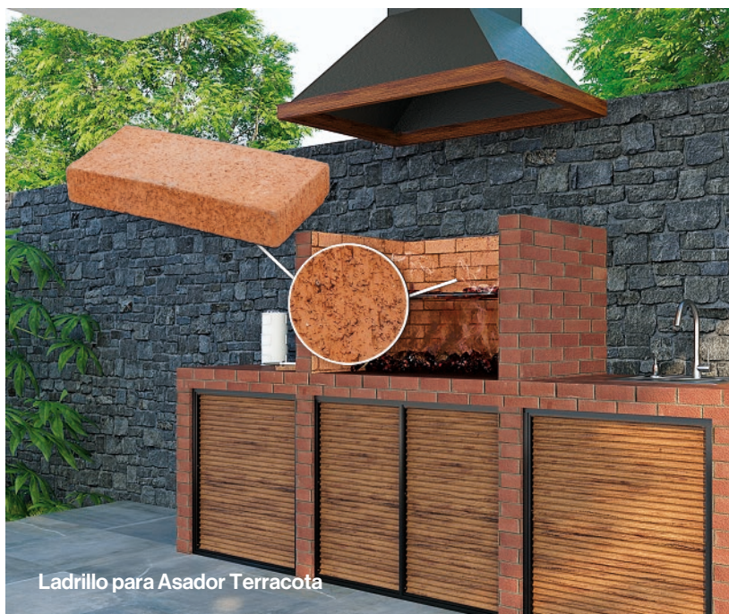
Ladrillo para Asador Terracota